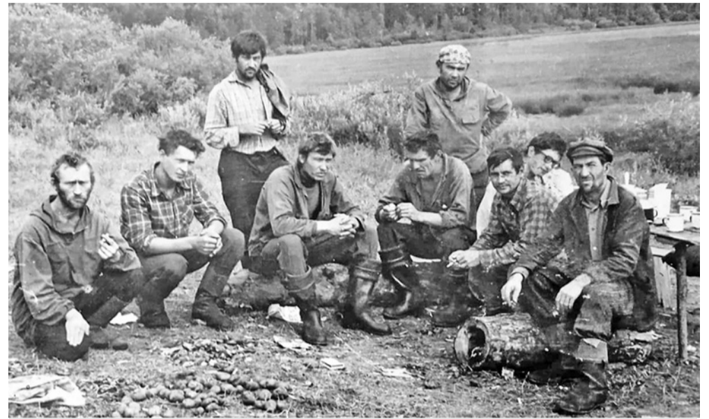
Лесная охрана на пожаре "Чимбуки", 1979 год